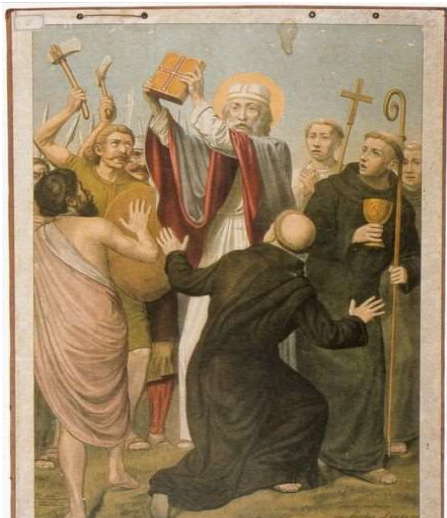
Vijanden staan zendeling Bonifatius (675 – 754) naar het leven

De kerkgeschiedeniskring Linschoten en omgeving gaat ook dit seizoen weer van start. Als je verdieping zoekt en je wilt je bezinnen op je wortels: weet je welkom. We komen zes keer per seizoen op donderdagavond bijeen om teksten te lezen en te bespreken uit de eeuwenlange traditie van de kerk. Er is een inleiding die ondersteund wordt met beeldmateriaal.